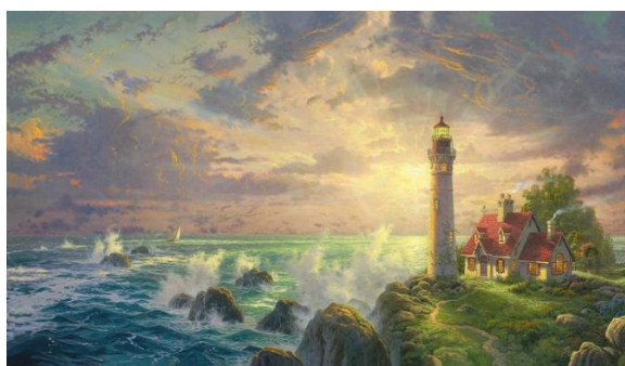
Томас Кинкейд. Морской пейзаж.