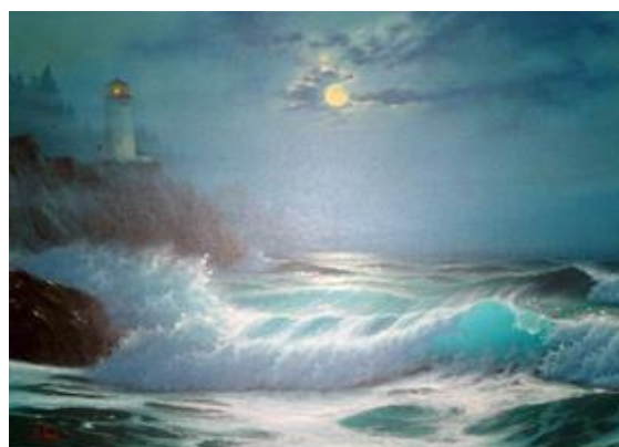
Игорь Оноприенко. Маяк в лунную ночь.